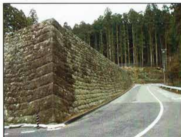
復旧状況（平成27年2月）