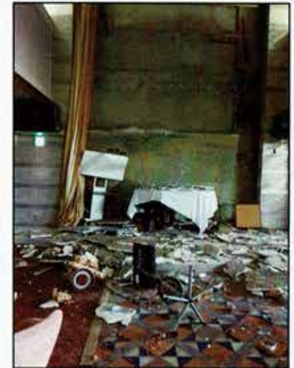
ロビーの壁面崩落 ※秋保温泉における被害の状況