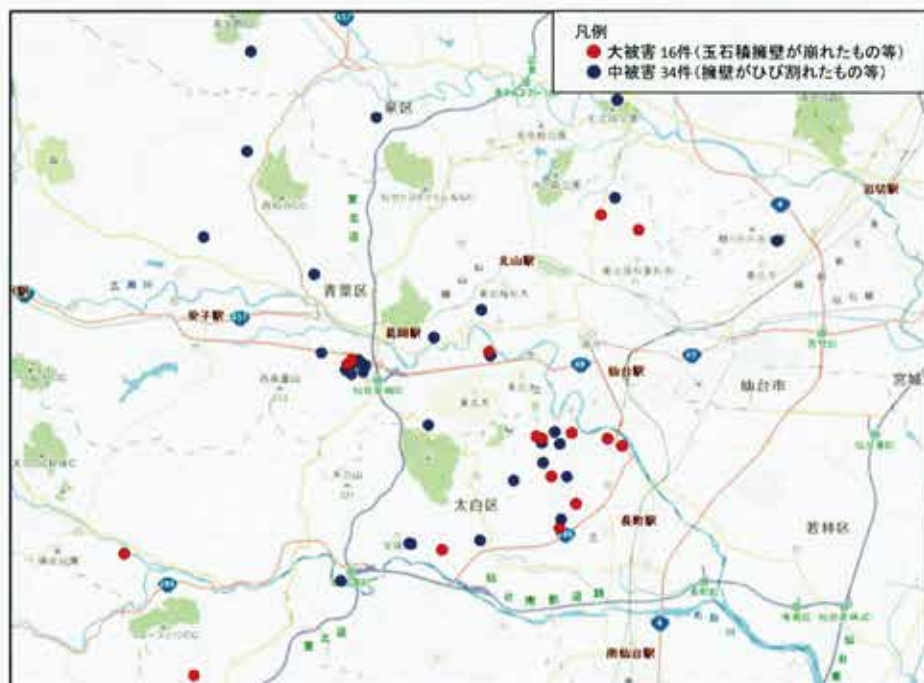
宅地被害の分布（令和4年3月31日現在）