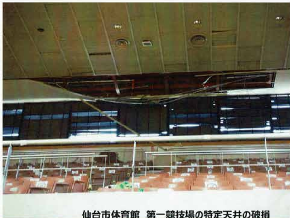
仙台市体育館 第一競技場の特定天井の破損