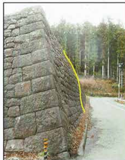
②石垣の変形（せり出し）