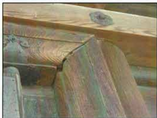
被害① 継ぎ目に隙間が発生