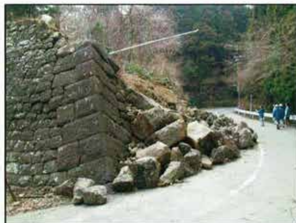
被災状況（平成23年3月）