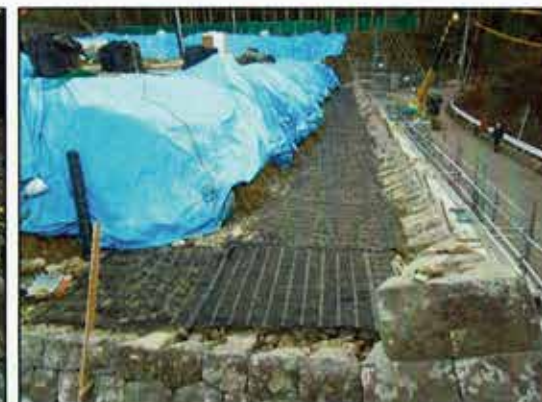
復旧作業状況（左：伝統工法に基づく石積みの施工状況、右：一部に導入した現代工法の施工状況）