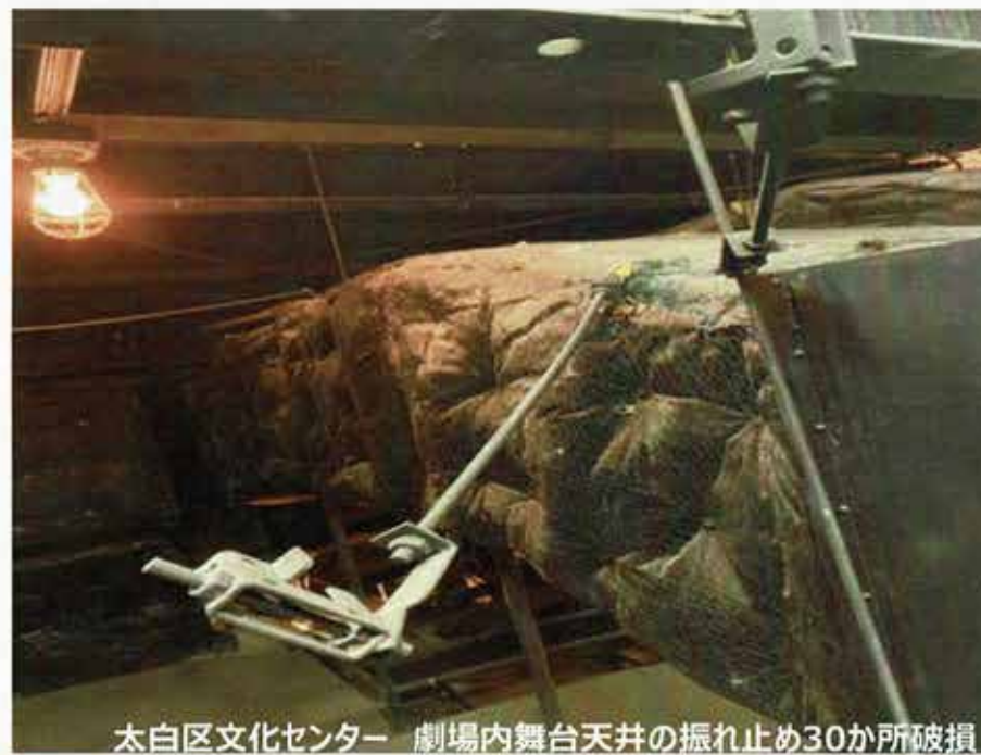
太白区文化センター 劇場内舞台天井の振れ止め30か所破損