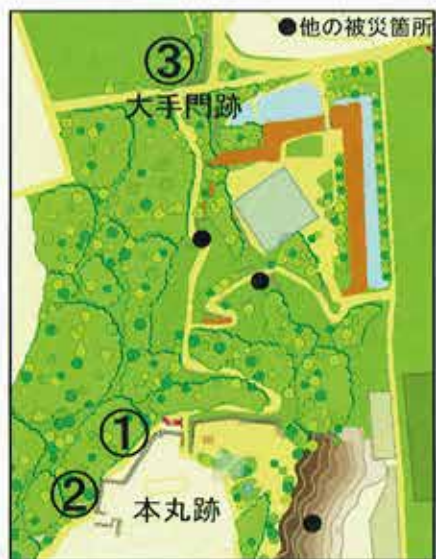
主な被災箇所（数字は写真に対応）