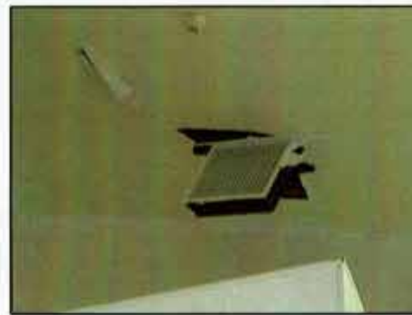
給食施設の空調設備落下