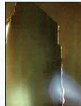
博物館の展示ケース破損