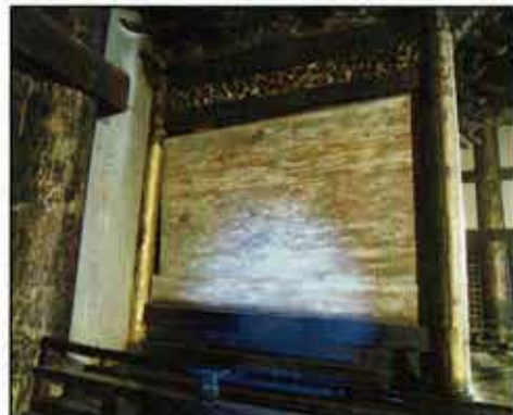
被害② 厨子のゆがみによる板壁の外れ