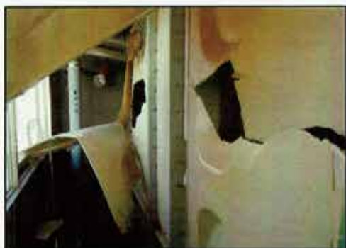
学校施設の高架水槽破損