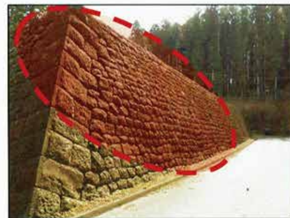
令和4年福島県沖地震での被災状況（変形箇所）