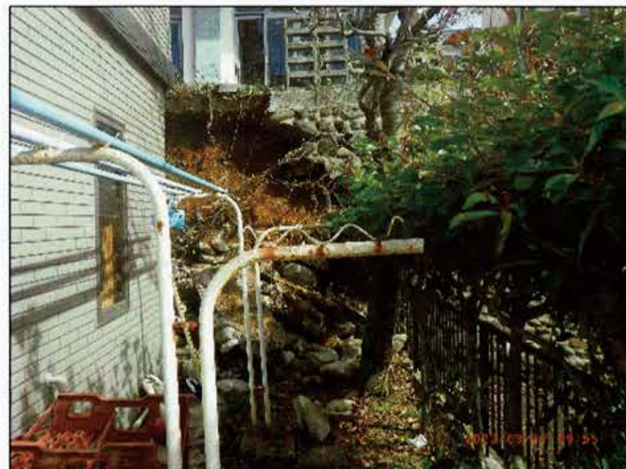
玉石積擁壁の崩壊