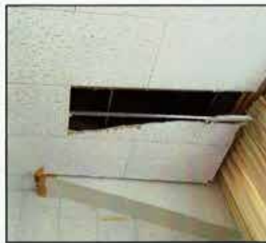
学校施設の天井落下